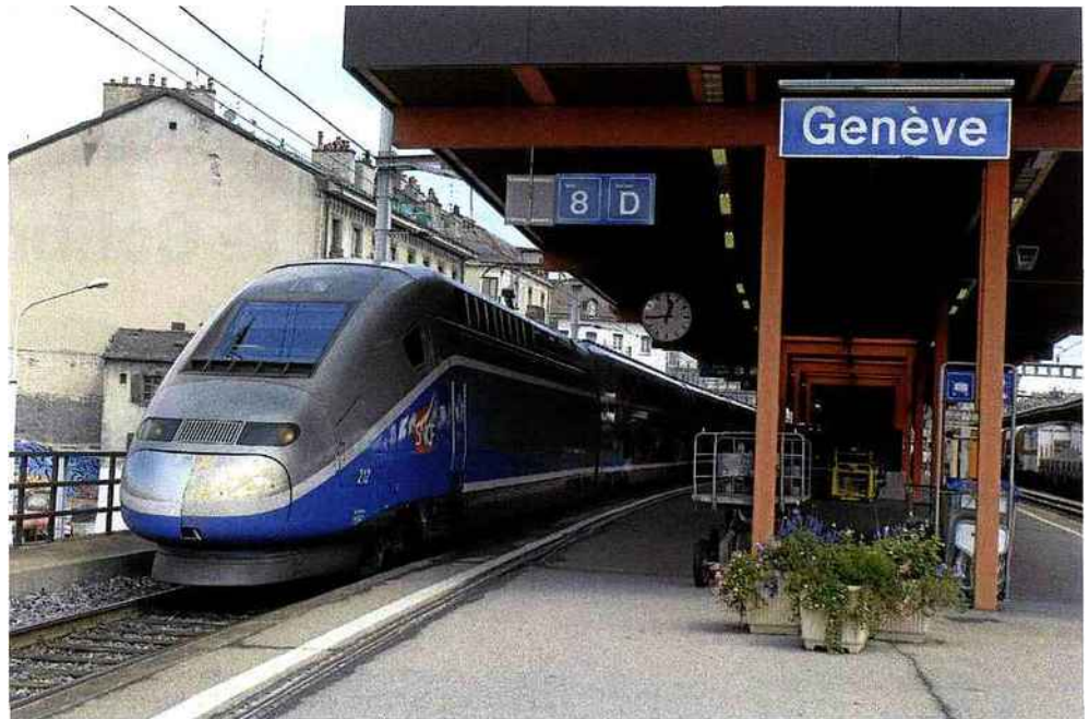
Duplex Lyria à Genève : l'ouverture, en 2010, de la ligne du haut Bugey devrait dynamiser l'offre Paris - Geneve (août 2007).

du retard, fera tomber le meilleur temps de parcours Paris - Genève à 3 heures 05 (3 heures 22 actuellement). Deux ou trois AR quotidiens devraient s'ajouter aux sept AR actuels. La trame sera cadencée à l'heure aux pointes du matin et aux 2 heures en milieu de journée. À noter que la relation Paris - Neuchâtel - Berne a enregistré une baisse de 10 % du nombre de voyageurs en 2008, la clientèle préférant passer par la LGV Est. Pourtant, aucune décision n'est prise quant à la suppression de cette destination.